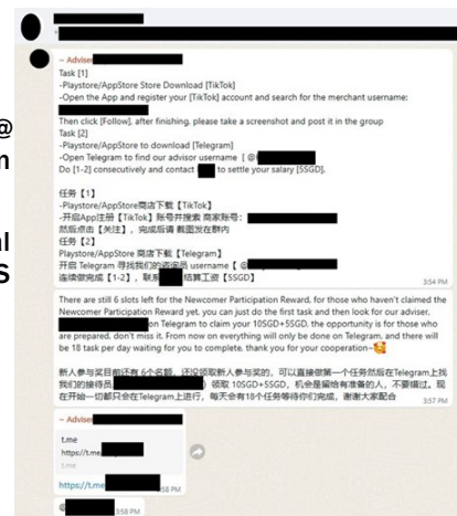
Scammer impersonating recruiter offering quick cash

For more information on this scam, visit SPF | News (police.gov.sg)