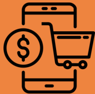
电子商务骗局 (各种手法)