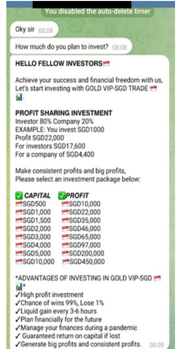
Fake investment opportunity from Telegram Chatgroup

TELL – Authorities, family, and friends about scams. Report the fraudulent page/listing to the online platform! Report the scammers or group chat using the in-app reporting function to WhatsApp and Telegram. If you suspect that you are a victim, file a police report immediately.