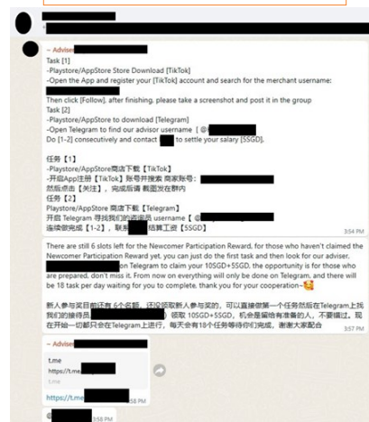
骗子冒充招聘人员提供赚钱机会