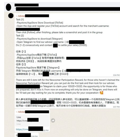
Penipu menyamar sebagai perekrut menawarkan wang tunai dengan cepat